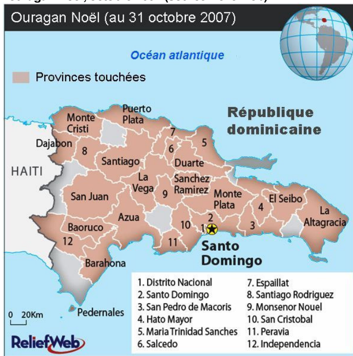
Figure 3: Zones de la République Dominicaine touchées par l'ouragan Noël, octobre 2007.